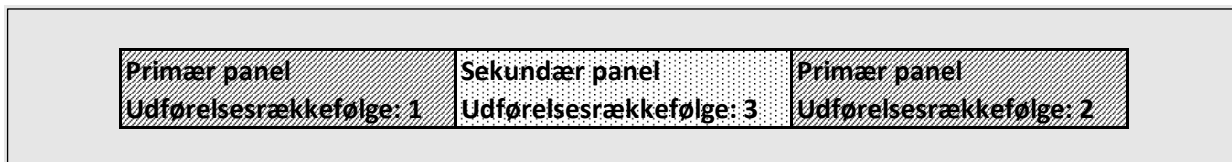
Figur 2, Slidsevæg, definitioner og udførelsesrækkefølge

Primære panelerne på hver side af et sekundært panel skal udføres forud for etablering af sekundærpanelet, se figur 2.